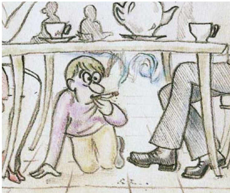
Рисунок Дмитрия Чурикова

Протесты против ограничения курильщиков в правах высказываются почти во всех странах, вводящих антитабачные законы. У курильщиков даже есть своя «Организация за свободное право получать удовольствие от табакокурения» – FOREST (Freedom Organization for the Right to Enjoy Smoking Tobacco). Но, если верить опросам, более половины курильщиков сами ратуют за введение вменяемых ограничений, таких как локализация мест курения, запрет продажи сигарет детям и подросткам и т.д. Да и сами табачные компании тратят огромные средства на разработку «менее вредных» сигарет.